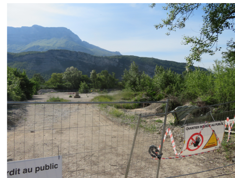
Friche urbaine le long de l'avenue Victor Hugo en cours de dépollution symbolisant la dynamique urbaine de transformation au nord de la ville de Pont-deClaix

Ces deux axes forts de la réhabilitation du quartier des Îles de Mars autour de l'ancien collège s'accompagnent d'un changement en profondeur autour et sur le quartier (voir tableau ci-contre).