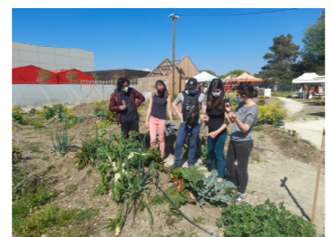
Une ferme urbaine maraîchère dans le Sud de la France