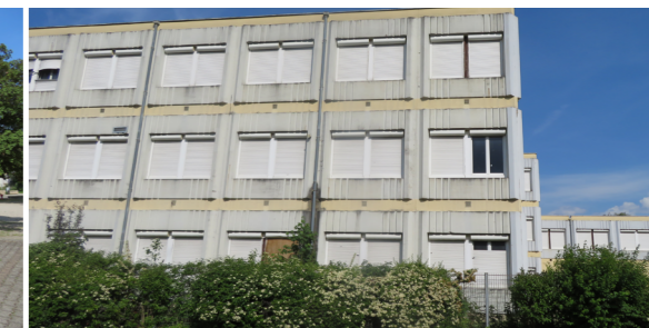
Ex-collège des Iles de Mars : vue depuis la place Couëtoux