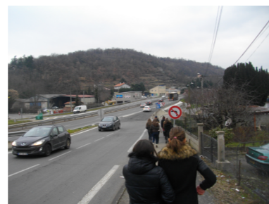
Exemple d'un diagnostic participatif en marchant, 2019