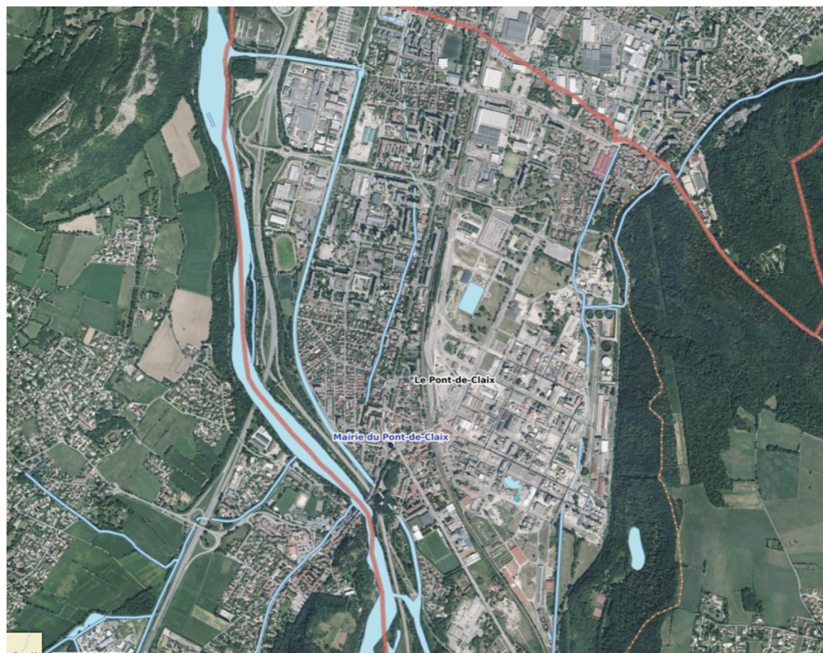
Photographie aérienne de Pont-de-Claix : En haut les nouveaux quartiers, la zone de développement de la ville, en bas le centre historique

[La ville est dans une dynamique de renouvellement urbain sur l'ensemble de son territoire : réaménagement du centre-ville, ZAC des papeteries au sud, zac des Minotiers au nord].