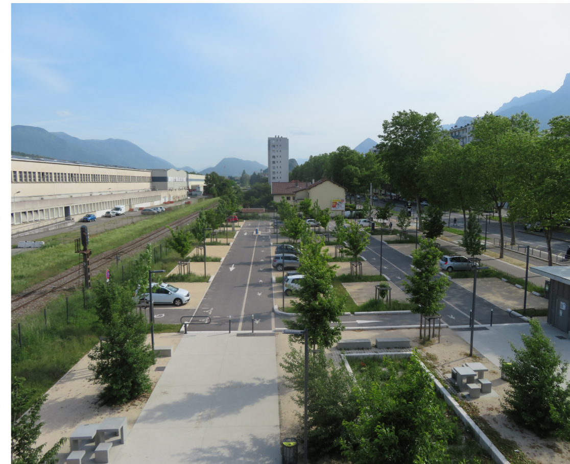
ZAC des Minotiers : vue depuis la station de tramway A , la ville accueillera près de 2000 logements dans ce secteur

Cette dynamique importante est à relier à une situation géographique privilégiée de la commune. La ville se trouve au Sud de l'agglomération grenobloise et le voisinage direct de l'environnement naturel (montagne, fleuve, colline) semble appeler et faciliter l'accès aux plaisirs de la montagne. Ce cadre est attractif.