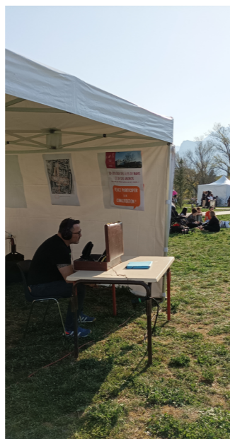
Atelier dans la rue, 2022