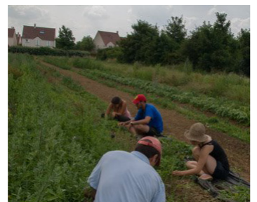
Une ferme urbaine maraîchère autour de Paris