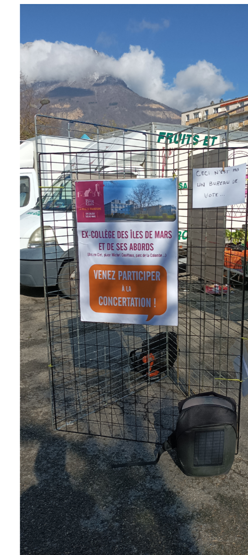
Stand d'Information en Espace Public : jour de marché à Pont-de-Claix