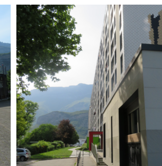
Quartier Olympiades au nord du quartier: Accès et entrée d'immeuble