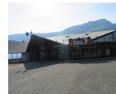
Équipement culturel l'amphi : vue depuis la place Couëtoux