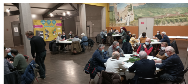
Exemple d'un débat participatif et collaboratif entre les habitants et les élus, 2021