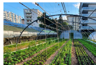
Une ferme urbaine maraîchère à Annecy