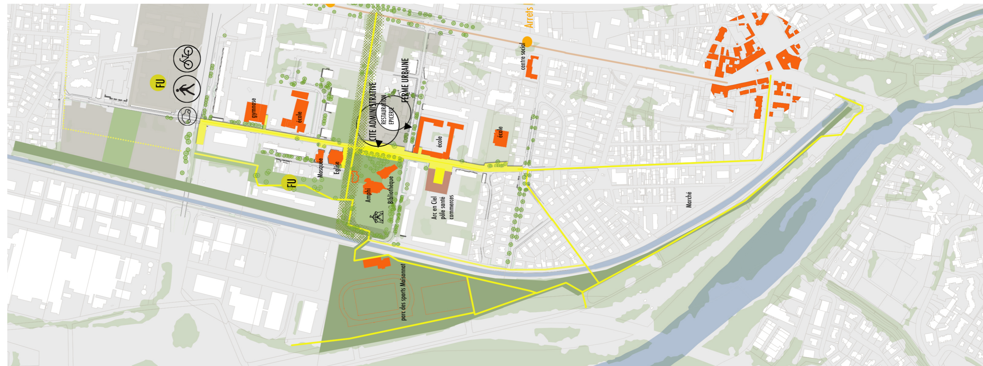
Carte de synthèse des enjeux : Les deux cercles noirs le site de l'ancien collège des Îles de Mars, en jaune épais l'avenue Victor Hugo : la colonne vertébrale du quartier, en orange les nombreux équipements à relier, à droite le centre-ville historique, en vert foncé les espaces verts deuxième point fort du quartier.