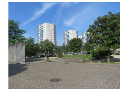
Quartier des Iles de Mars : vue depuis la place Couëtoux

Le quartier est doté de plusieurs espaces végétalisés, notamment le Parc de la Colombe. Les bords du Drac ne sont pas loin, un défi consiste à réduire la barrière de l'autoroute, qui constitue pour l'instant une frontière. Le quartier est connecté aux infrastructures de transport essentiellement par le cours Saint-André et bénéficie d'une connexion directe avec l'A48.